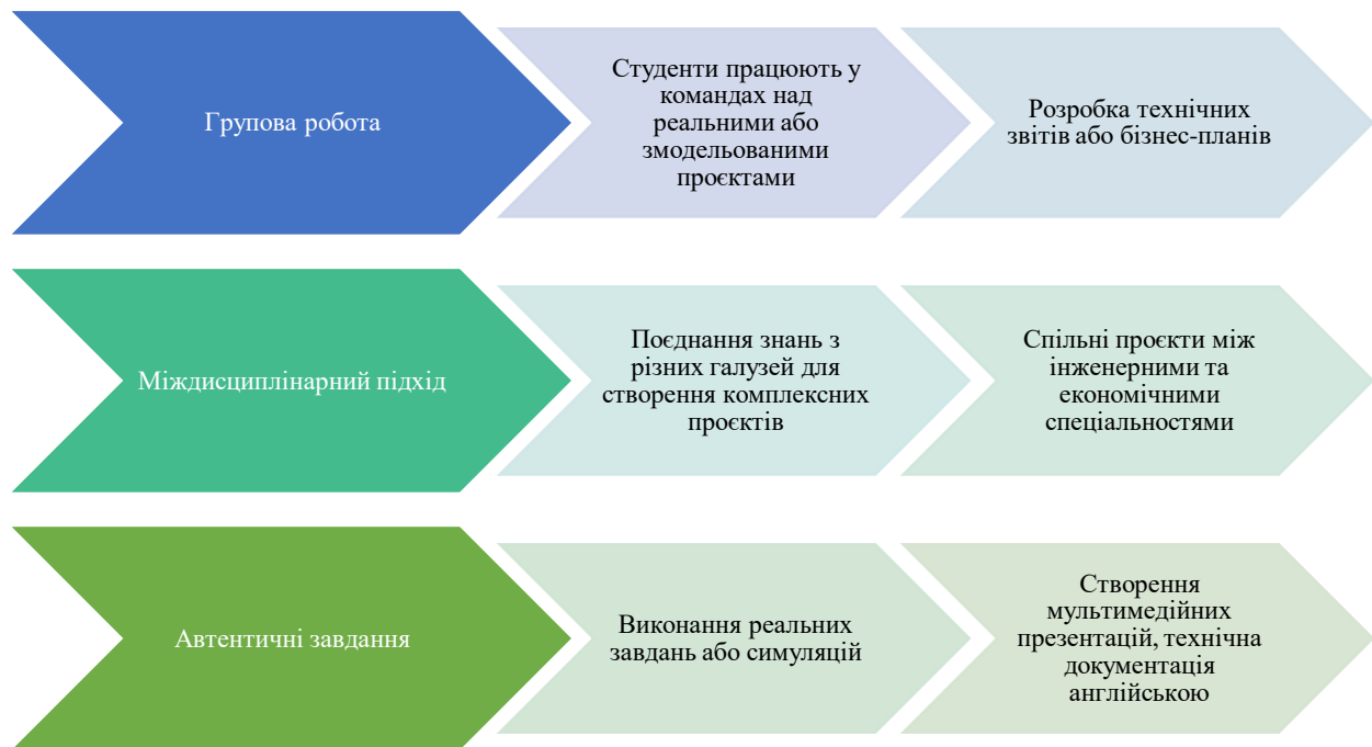
Рис 3.1. Основні аспекти проектного навчання

які включають студентів різних спеціальностей, що працюють у командах над реальними проблемами бізнесу або технологій, використовуючи англійську як основну робочу мову. Ці кейси показують, що проектне навчання допомагає студентам не лише покращувати мовленнєві навички, а й розвивати необхідні професійні компетентності в реальних умовах.