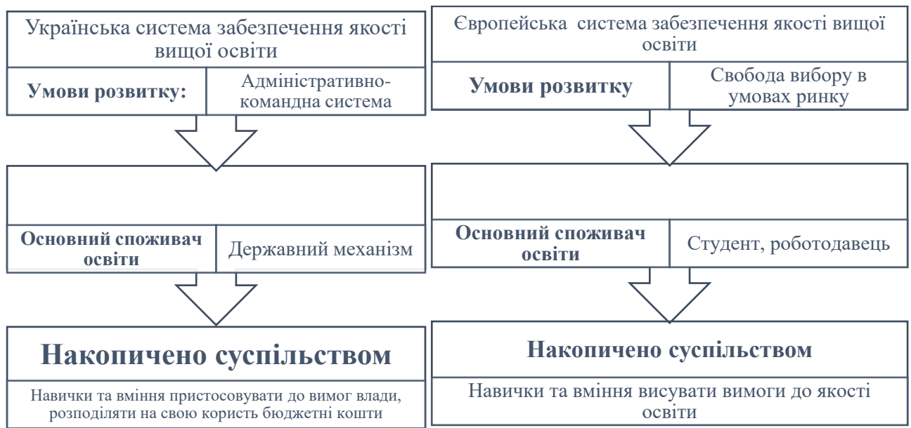
Рисунок 3.1 – Відмінності у формуванні української та європейської систем забезпечення якості освіти [34].

Медіаосвіта та інформаційна культура. В умовах війни медіа мають величезний вплив на формування громадянської культури, оскільки вони сприяють поширенню важливої інформації та можуть служити засобом формування громадської думки. Однак в умовах гібридної війни, коли ворог активно використовує інформаційні маніпуляції, критичне сприйняття медіа стає надзвичайно важливим для громадян. Медіаосвіта стає необхідним інструментом для формування здатності до критичного мислення та інформаційної безпеки. Прикладами медіаосвіти можуть бути курси з медіаграмотності: онлайн-курси, такі як Coursera, edX, надають можливість студентам вивчати теорію та історію медіа, основи роботи з цифровими технологіями, а також надає базові навички створення медіа-контенту; спеціалізовані курси та тренінги для журналістів, такі як відеоблогінг, підкасти, соціальні медіа, тощо; медіа лабораторії; воркшопи і тренінги по боротьби з фейками; медіа-арт і творчі ініціативи. Медіаосвіта є важливою для розвитку критичного мислення, допомагає зрозуміти складність медіапейзажу і робить людей більш свідомими споживачами медіа. Важливо вміти правильно аналізувати інформацію, яка подається у світі соціальних мереж і чим більше буде компетентних професіоналів, тим чистіший стане медіа простір.