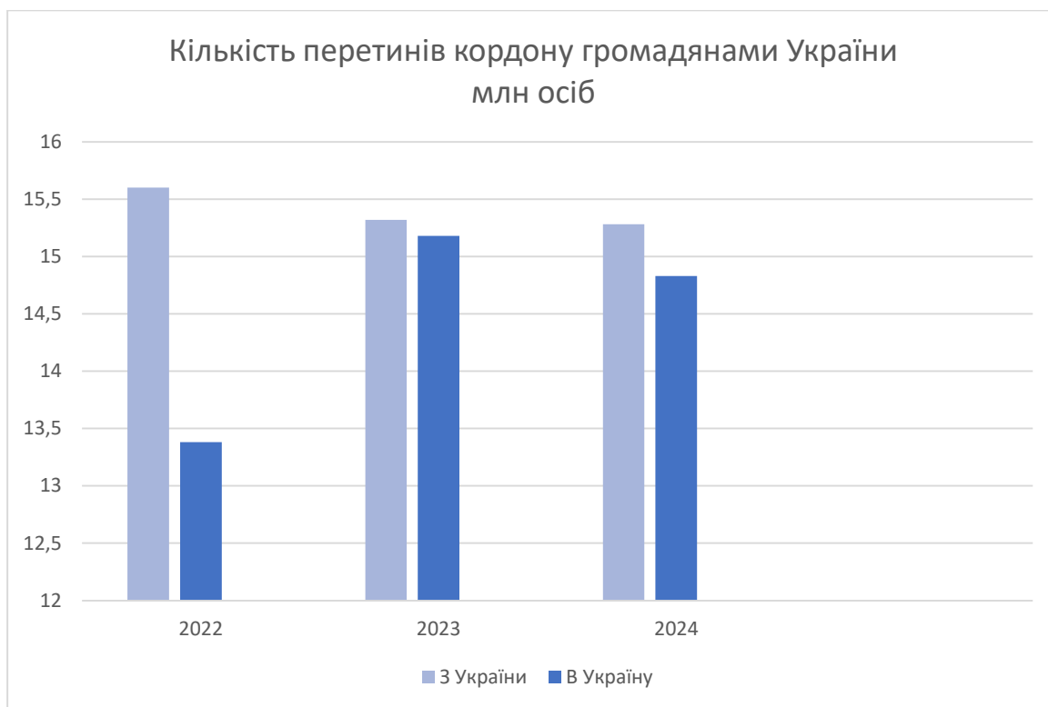
Рисунок 1.1 Кількість перетину кордону громадянами України в 2022-2024 рр., млн. осіб.

Відповідно до статистики Державної прикордонної служби, протягом 2024 року зафіксовано більше 30 мільйонів перетинів державного кордону України. Аналітична платформа Опендатабот зазначає, що з цієї кількості 443 тисячі громадян не здійснили зворотного в'їзду до країни [34]