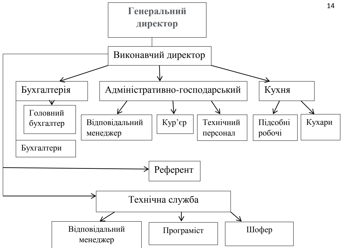
Рис. 1.1. Організаційна структура управління рестораном

Організаційна структура ресторану визначається чіткою лінією управління та розподілом обов'язків, що сприяє ефективному функціонуванню.