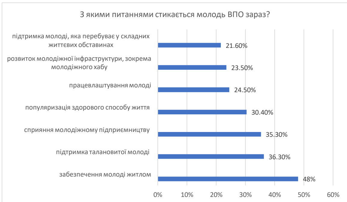
Рис. 3.3 З якими питаннями стикається молодь ВПО зараз