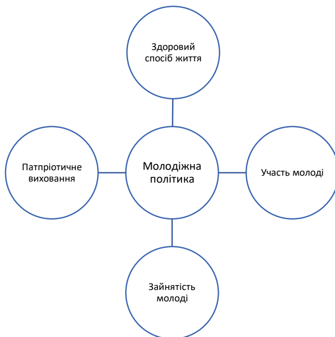
Рис. 1.1. Пріоритетні напрями розвитку молодіжної політики в Україні