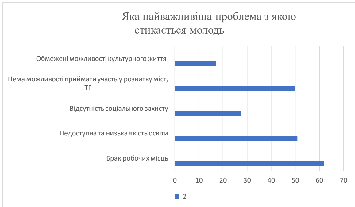
Рис. 2.2 Актуальні проблеми молоді на сучасному етапі

Навіть через усі досягнення цієї сфері молодь стикається з дуже багатьма проблемами в суспільстві, за для їх визначення, було впроваджено дослідження, результати якого наведені нижче на рис. 2.2, в дослідженні прийняло участь 40 чоловік, які мали право обрати декілька варіантів.