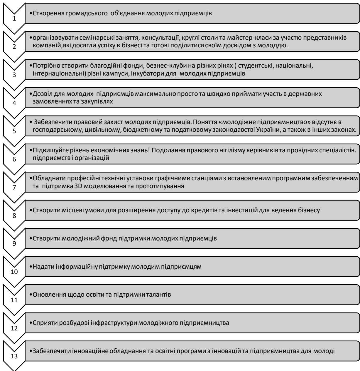
Рис. 3.2 Заходи, що сприяють реалізації молодіжного підприємництва

Джерело: узагальнено автором [35; 36; 37, с.39; 38, с.360]