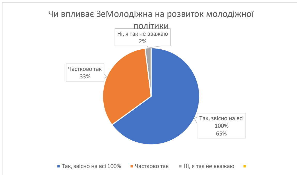
Рис.1.2. Чи впливає ЗеМолодіжка на розвиток молодіжної політики?

вісімсот прихильників з усього міста. Нещодавно серед прихильників крила було проведено опитування на тему «молодіжна політика», де вони оцінювали вплив ЗеМолодіжки на молодіжну політику, та загальну ситуацію в країні у цій сфері, в дослідженні прийняло участь 40 респондентів. Молодіжний рух дійсно займається розвитком політики у сфері молоді, це ми можемо бачити нижче на графіку.